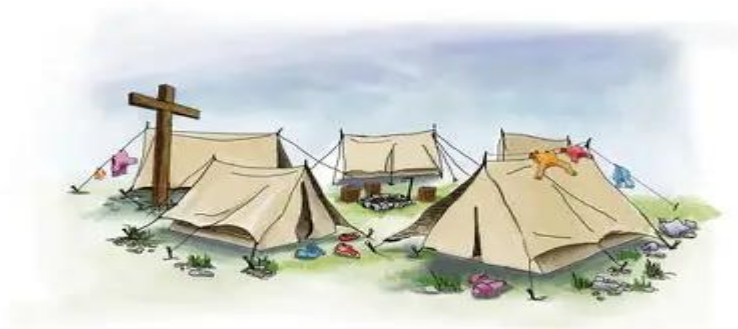
Pfarrbriefservice: kostenlose Bilder